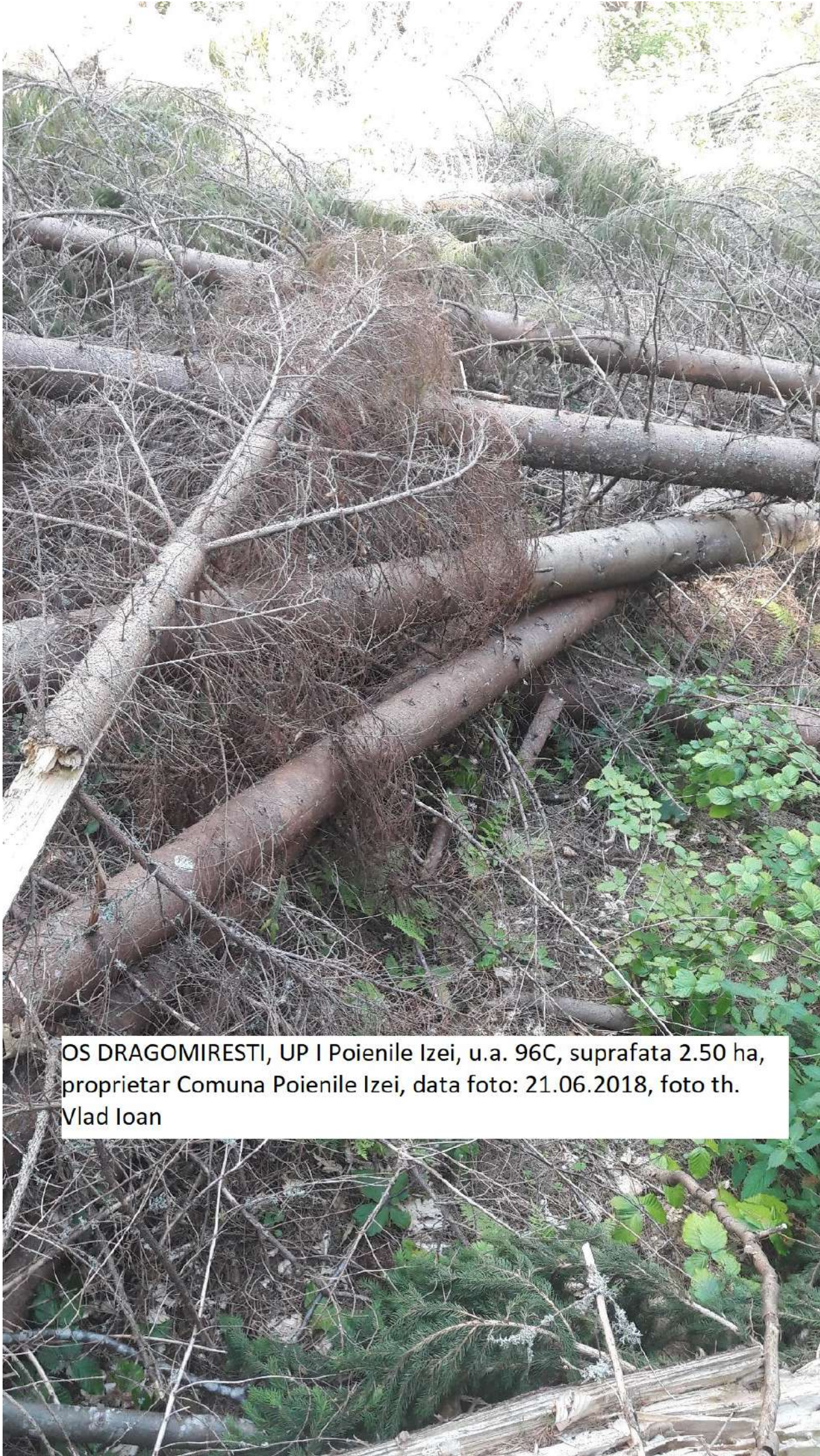
OS DRAGOMIRESTI, UP I Poienile Izei, u.a. 96C, suprafata 2.50 ha, proprietar Comuna Poienile Izei, data foto: 21.06.2018